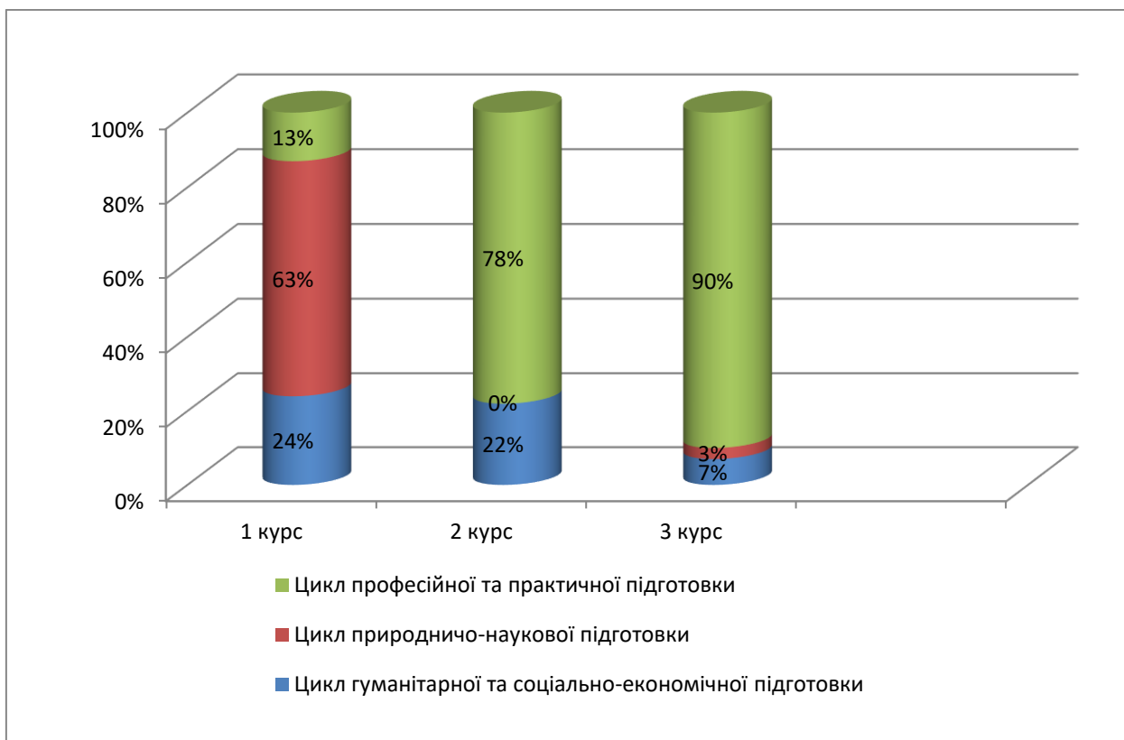
Рис. 2. Діаграма розподілу освітніх компонент (ОК) в рамках освітньо-професійної програми підготовки фахового молодшого бакалавра на основі повної загальної середньої освіти зі спеціальності 223 Медсестринство спеціалізації «Лікувальна справа».

гуманітарної та соціально-економічної підготовки, природничо-наукової підготовки, професійної підготовки ОП за курсами навчання в залежності від кількості кредитів ECTS (рис. 2).